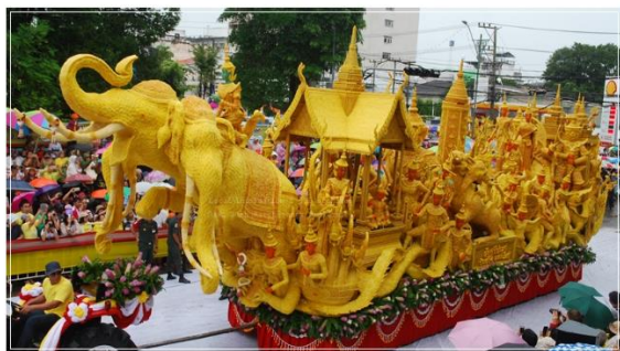
เทียนพรรษามอราชธานี ประเภทติดพิมพ์

๓. ต้นเทียนพรรษาประเภทแกะสลัก เทียนพรรษาประเภทแกะสลัก หมายถึง ประติมากรรมเทียนที่สร้างส่วนต่าง ๆ โดยวิธีการใดก็ตาม แล้วตกแต่งให้ผิวภายนอกเป็นเนื้อเทียน จากนั้นใช้เครื่องมือที่มีคมขนาดต่าง ๆ หรือเครื่องมือแกะสลักลงไปเนื้อเทียนเพื่อให้เกิดรูปร่างหรือเรื่องราวตามที่ต้องการ ขั้นตอนการทำต้นเทียนประเภทแกะสลัก จะมีการจัดเตรียมคล้ายกับการจัดทำต้นเทียนประเภท ติดพิมพ์ แต่จะมีส่วนที่แตกต่างกัน คือ ขี้ผึ้งและลักษณะการออกแบบต้นเทียน คุณภาพของขี้ผึ้งที่ใช้ทำต้นเทียน ประเภทติดพิมพ์เป็นขี้ผึ้งคุณภาพพอใช้ได้ หรือจะเรียกว่าขี้ผึ้งผสมก็ได้ ส่วนขี้ผึ้งที่ใช้ทำต้นเทียนประเภทแกะสลัก จำเป็นต้องใช้ขี้ผึ้งที่มีคุณภาพดี