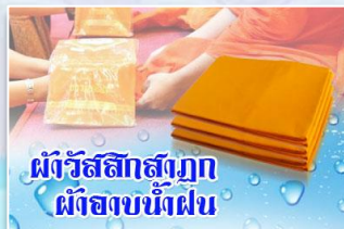
ผ้าวัสสิกสาฎก ผ้าอาบน้ำฝน

ผ้าอาบน้ำฝน มักเรียกเพี้ยนไปว่า ผ้าจำนำพรรษา คงเพราะเข้าใจผิดคิดว่าเป็นผ้าแบบเดียวกัน หรือเพราะมีการถวายก่อนเข้าพรรษาเพียงวันสองวัน จึงเรียกว่าผ้าจำนำพรรษา ทั้งที่เป็นผ้าต่างชนิดกัน