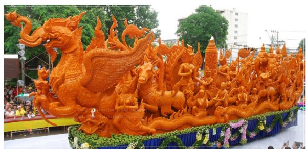
เทียนพรรษามอราชธานี ประเภทแกะสลัก

๓. ต้นเทียนพรรษาประเภทแกะสลัก เทียนพรรษาประเภทแกะสลัก หมายถึง ประติมากรรมเทียนที่สร้างส่วนต่าง ๆ โดยวิธีการใดก็ตาม แล้วตกแต่งให้ผิวภายนอกเป็นเนื้อเทียน จากนั้นใช้เครื่องมือที่มีคมขนาดต่าง ๆ หรือเครื่องมือแกะสลักลงไปเนื้อเทียนเพื่อให้เกิดรูปร่างหรือเรื่องราวตามที่ต้องการ ขั้นตอนการทำต้นเทียนประเภทแกะสลัก จะมีการจัดเตรียมคล้ายกับการจัดทำต้นเทียนประเภท ติดพิมพ์ แต่จะมีส่วนที่แตกต่างกัน คือ ขี้ผึ้งและลักษณะการออกแบบต้นเทียน คุณภาพของขี้ผึ้งที่ใช้ทำต้นเทียน ประเภทติดพิมพ์เป็นขี้ผึ้งคุณภาพพอใช้ได้ หรือจะเรียกว่าขี้ผึ้งผสมก็ได้ ส่วนขี้ผึ้งที่ใช้ทำต้นเทียนประเภทแกะสลัก จำเป็นต้องใช้ขี้ผึ้งที่มีคุณภาพดี