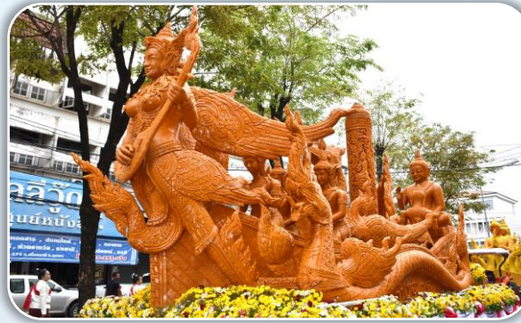
การถวายผ้าอาบน้ำฝน

ผ้าอาบน้ำฝน คือ ผ้าที่พระสงฆ์ใช้ผลัดเปลี่ยนเวลาสรณังนามีคติเหมือนผ้าขาวม้า เรียกตามคำวัดว่า ผ้าวัสสิกสาฎก ผ้าอาบน้ำฝน เป็นผ้าที่พระพุทธเจ้าทรงอนุญาตให้พระสงฆ์ใช้ได้เป็นผืนที่ ๔ นอกเหนือจากผ้าไตรจีวร และทรงอนุญาตให้พระสงฆ์รับถวายได้ก่อนเข้าพรรษา ๑ เดือนที่เรียกว่าผ้าอาบน้ำฝน เพราะเป็นผ้าที่ถวายกันในวันฤดูฝนและนางวิสาขาเป็นคนแรกที่ได้ถวายผ้าอาบน้ำฝนแด่พระสงฆ์ จนกลายเป็นธรรมเนียมมาถึงปัจจุบัน